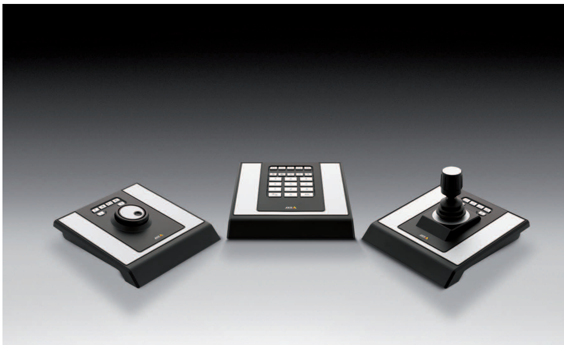
Tableau de contrôle modulaire pour la gestion professionnelle des vidéos et des caméras.