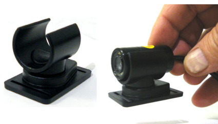
Mini support plastique orientable en rotation avec adhésif 3M sur la semelle

Cordons standards solidaires de la caméra, longueurs: 5 m, 10 m et 20m MC-P080/5 - MC-P080/10, MC-P080/20 Autres longueurs en option sur demande