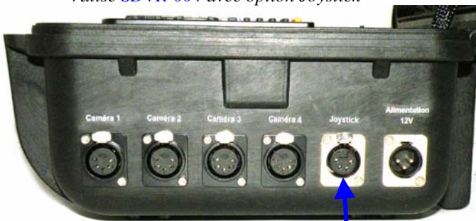
Valise SDVR-004 avec option Joystick