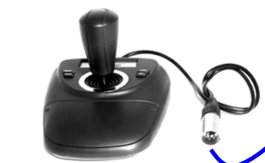
Joystick 3D optionnel pour caméras PTZ motorisées

Un connecteurs XLR 4 points permet la connexion du mini Joystick 3D optionnel KBM-781.